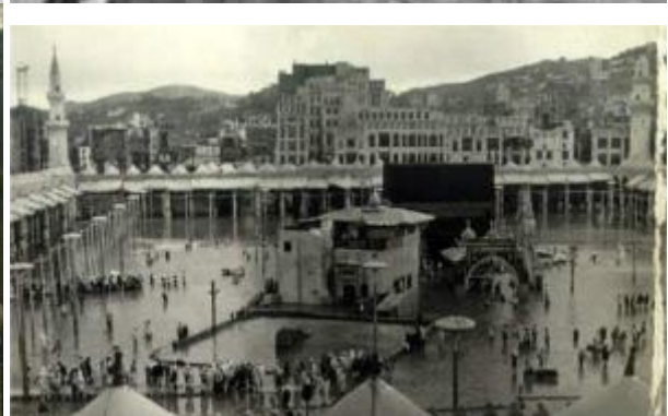
[regelmatige overstromingen te Mekka]